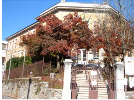
Cunardo Scuola Primaria e Secondaria di 1° grado