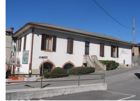
Ferrera di Varese Scuola dell'infanzia

Gli alunni di un quarto comune, Marzio, frequentano la scuola presso la sede di Cunardo.