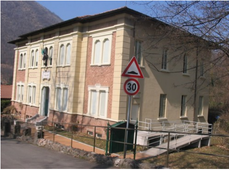
Valganna Scuola Primaria

L'I.C.S. di Cunardo è costituito da tre plessi situati nei comuni di: